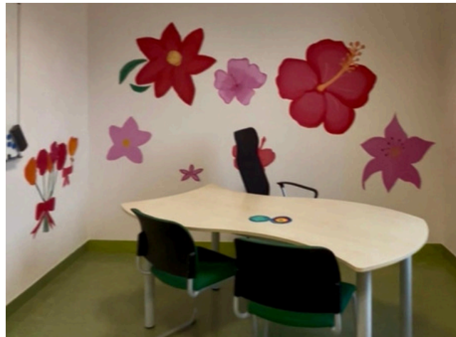
neu gestalteter Vertrauenslehrerraum, Raum 222

Ihr könnt euch bei akuten Problemen direkt in den Pausen an sie wenden oder sie zu ihren festen Zeiten im Vertrauenslehrerraum antreffen. Am besten ist es jedoch, vorab einen Termin zu vereinbaren – zum Beispiel per E-Mail oder über Untis. Außerdem gibt es die Möglichkeit, Anliegen anonym mitzuteilen, etwa über den Kummerkasten. Dabei solltet ihr jedoch beachten, dass eine Rückverfolgung nicht möglich ist und das Problem daher nicht aktiv weiterverfolgt werden kann. Wenn es allerdings um Schwierigkeiten geht, die eine größere Gruppe betreffen – etwa euren Freundeskreis oder eure Klasse – kann dies trotzdem ein sinnvoller Weg sein, um auf ein Problem aufmerksam zu machen, ohne sich persönlich zu offenbaren.