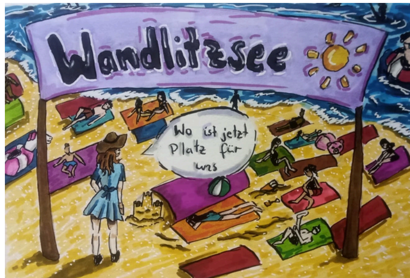
Schülerzeichnung zu "Ruhe vor dem Sturm" von R.B.