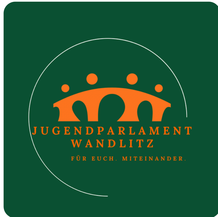
Logo des Jugendparlaments Wandlitz

Denn am Ende sollte Sport nicht nur um Medaillen gehen, sondern auch um die Menschen dahinter. ~M.S.